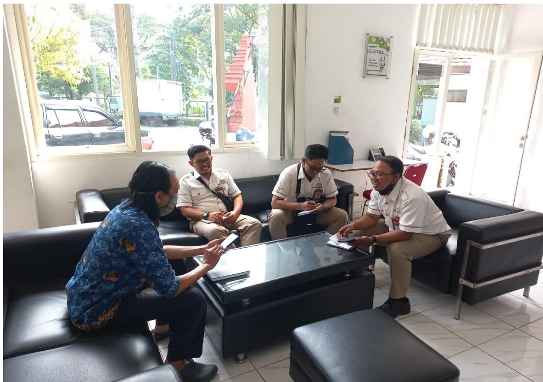
Konsultasi pengelolaan Limbah B3 dengan perusahaan galangan kapal pada tanggal 17 Mei 2023