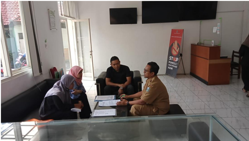
Konsultasi rintek PT Tasland Indonesia (Hotel Premier Juanda) dan Pertek Pengumpulan PT Wahana Lestari Bersatu pada tanggal 29 Mei 2023.