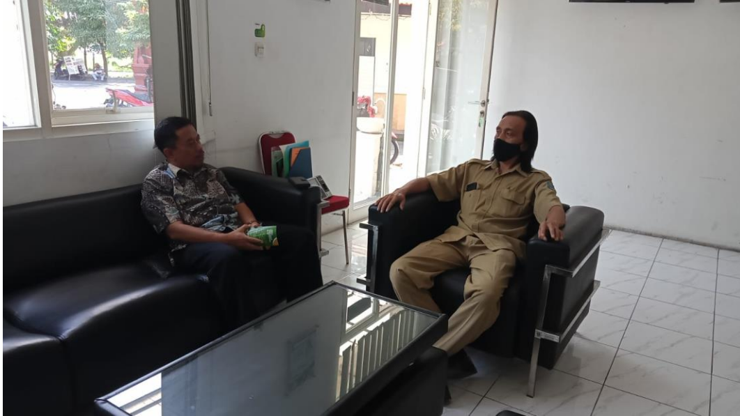
Konsultasi penyusunan TPS oleh Hotel Milik Muhamaddiyah di dekat Unmuh Malang (Rayz Hotel) pada tanggal 29 Mei 2023.