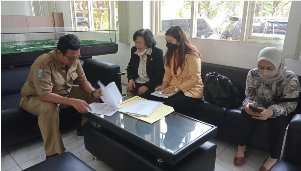
Konsultasi Rincian Teknis dengan RS Ubaya pada tanggal 6 Juni 2023